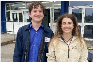
Llongyfarchiadau Bl 13!

Canlyniadau Safon Uwch, BTEC, UG, TGAU a galwedigaethol: Rydym yn falch iawn o ddathlu llwyddiant ein myfyrwyr yn eu harholiadau. O ran Blwyddyn 13, sicrhodd y mwyafrif helaeth o fyfyrwyr leoedd yn eu dewis cyntaf Prifysgol neu ar gyfer cyrsiau newydd. Roedd y canlyniadau cyffredinol yn ardderchog, gyda 35% o fyfyrwyr yn llwyddo gydag o leiaf 3A* neu A o fewn Safon Uwch a 91% o bob gradd a ddyfarnwyd, yn A*- C. Mae'r graddau rhagorol yma yn dystiolaeth o ymroddiad aeddfed a gwaith caled ein myfyrwyr yn ogystal â chefnogaeth athrawon a thiworiaid yr ysgol. Llongyfarchiadau hefyd i fyfyrwyr Bl12 ar eu canlyniadau UG sy'n darparu sylfaen gadarn ar gyfer astudiaethau Bl13. O ran Bl11, roedd yn wych i weld disgyblion yn dathlu a gweld bod 85% wedi sicrhau o leiaf 5 A*-C a 36% o fyfyrwyr yn ennill o leiaf 5 A*/A. Derbyniodd disgyblion yn Bl10 ganlyniadau mewn Gwyddoniaeth, Addysg Gefyddol a modiwlau yn Hanes, y Gymraeg a'r Saesneg oedd hefyd yn ganlyniadau sy'n argoeli'n dda ar gyfer Haf 2024. Llongyfarchiadau felly i'r holl ddisgyblion ar y canlyniadau hyn ac rydym yn dymuno'n dda iddynt i'r dyfodol gan ddiolch iddynt am eu cyfraniad didwyl i gymuned Glantaf.