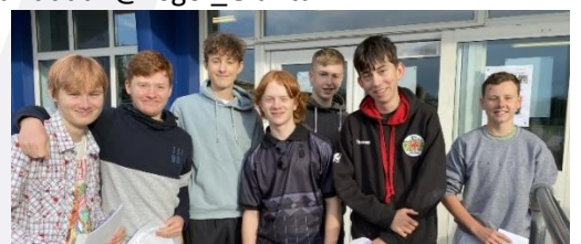
Pawb yn gwenu wrth ddatlu canlyniadau TGAU!