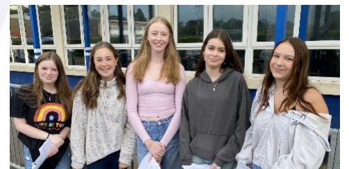
Llwyddiant TGAU i Bl 11!

Cludiant ysgol: Dylech fod wedi derbyn cadarnhad o lwybrau bysiau a thacsis os yw'ch plentyn yn gymwys i gael trafndiaeth am ddim. Mae amserlen Bws Caerdydd hefyd ar gael ar gyfer y bws 615: School Services from September 2023 - Cardiff Bus Bydd trwyddedau teithio yn cael eu dosbarthu i ddisgyblion ar ddechrau'r tymor a bydd eu hangen ar gyfer pob taith o Ddydd Llun 11 Medi.