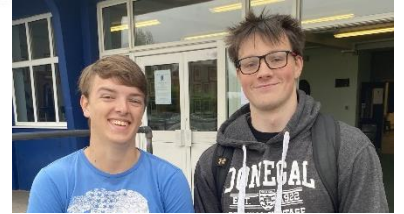
Enillodd 35% o fyfyrwyr Bl13 o leiaf 3 A*/A

Canlyniadau Safon Uwch, BTEC, UG, TGAU a galwedigaethol: Rydym yn falch iawn o ddathlu llwyddiant ein myfyrwyr yn eu harholiadau. O ran Blwyddyn 13, sicrhodd y mwyafrif helaeth o fyfyrwyr leoedd yn eu dewis cyntaf Prifysgol neu ar gyfer cyrsiau newydd. Roedd y canlyniadau cyffredinol yn ardderchog, gyda 35% o fyfyrwyr yn llwyddo gydag o leiaf 3A* neu A o fewn Safon Uwch a 91% o bob gradd a ddyfarnwyd, yn A*- C. Mae'r graddau rhagorol yma yn dystiolaeth o ymroddiad aeddfed a gwaith caled ein myfyrwyr yn ogystal â chefnogaeth athrawon a thiworiaid yr ysgol. Llongyfarchiadau hefyd i fyfyrwyr Bl12 ar eu canlyniadau UG sy'n darparu sylfaen gadarn ar gyfer astudiaethau Bl13. O ran Bl11, roedd yn wych i weld disgyblion yn dathlu a gweld bod 85% wedi sicrhau o leiaf 5 A*-C a 36% o fyfyrwyr yn ennill o leiaf 5 A*/A. Derbyniodd disgyblion yn Bl10 ganlyniadau mewn Gwyddoniaeth, Addysg Gefyddol a modiwlau yn Hanes, y Gymraeg a'r Saesneg oedd hefyd yn ganlyniadau sy'n argoeli'n dda ar gyfer Haf 2024. Llongyfarchiadau felly i'r holl ddisgyblion ar y canlyniadau hyn ac rydym yn dymuno'n dda iddynt i'r dyfodol gan ddiolch iddynt am eu cyfraniad didwyl i gymuned Glantaf.